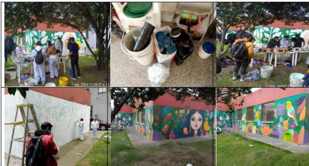
Imagen 20 Jornada de elaboración mural con la comunidad Parque la Herradura 07-09-24

Las capacitaciones impartidas a la comunidad se relacionan directamente con la tenencia responsable de mascotas y el manejo adecuado de residuos y conto la participación de las personas que colaboraron con la recolección de residuos como se muestra en la siguiente imagen