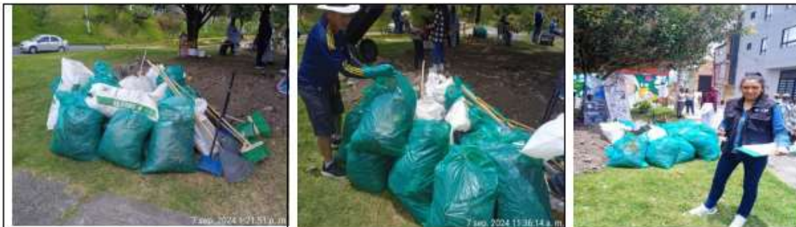
Imagen 18 Jornada de recolección de residuos Parque la Herradura 07-09-24

Las capacitaciones impartidas a la comunidad se relacionan directamente con la tenencia responsable de mascotas y el manejo adecuado de residuos y conto la participación de las personas que colaboraron con la recolección de residuos como se muestra en la siguiente imagen