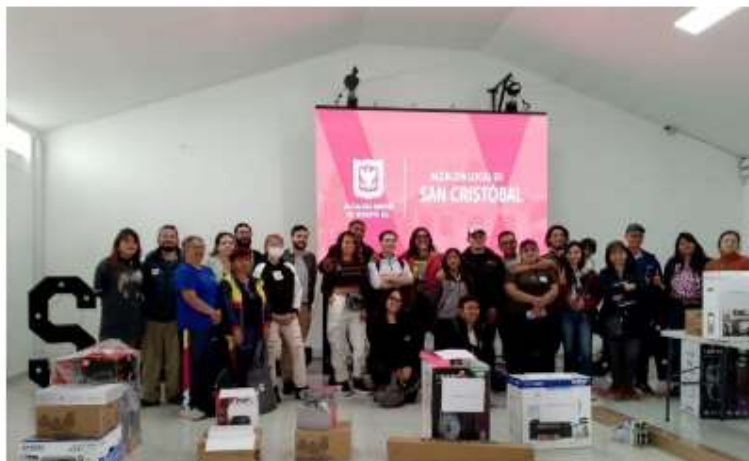
Imagen 40 Entrega de equipos tecnológicos grupo memorias del ecosistema

Se realizó un evento para la entrega de los elementos tecnológicos para el proyecto Memorias del ecosistema y caminos de biodiversidad, en la auditoria de la alcaldía de San Cristóbal, el día 1 de agosto de 2024 con el apoyo del equipo de Cidor SAS y la supervisión del contrato