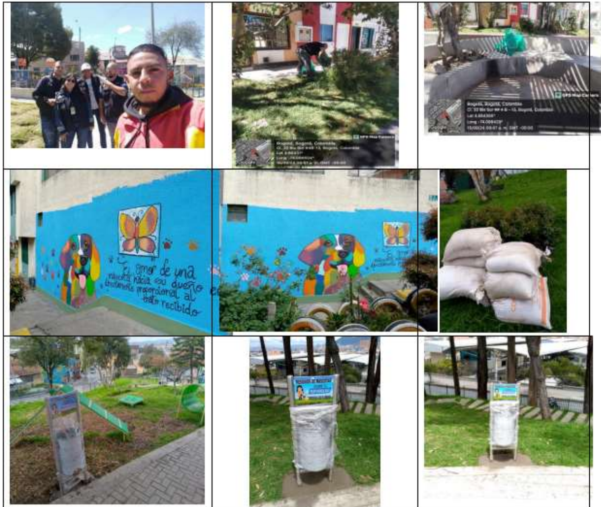
Imagen 31 Intervención parques villa de los Alpes I y II