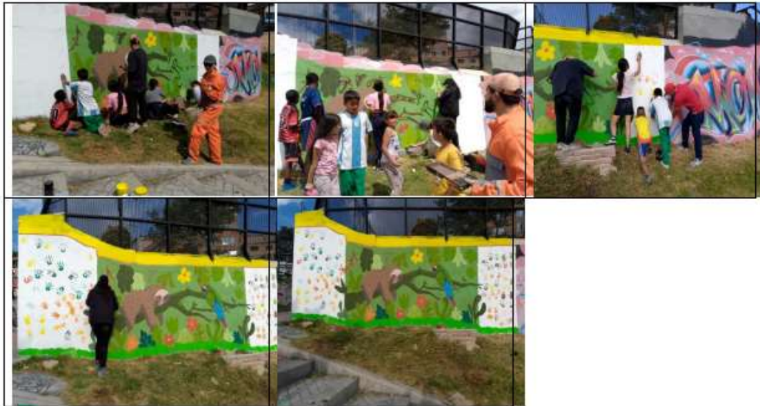
Imagen 24 Jornada de embellecimiento parque La Joyita 21-09-24

Se hizo entrega de 120 eugenias para ser plantadas por la comunidad, como apoyo la empresa Cidor Sas gestionó y preparó las zanjas para que la comunidad proceda a la plantación