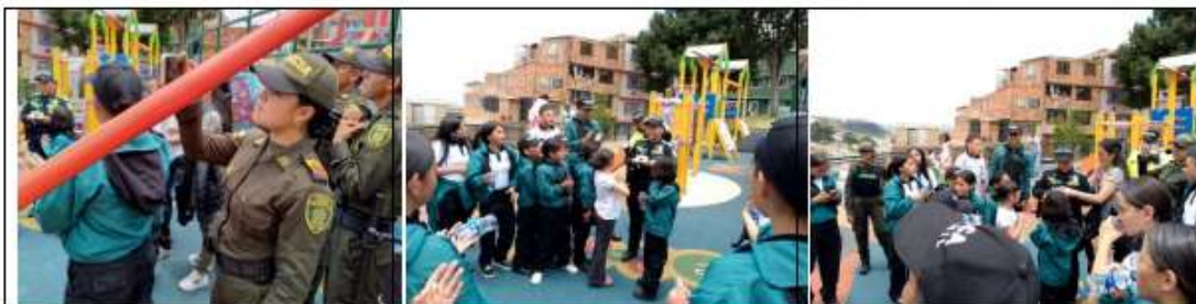
Imagen 23 Jornada de capacitación de residuos parque La Joyita 21-09-24

Para la jornada de embellecimiento del parque se propuso realizar un mural de 2 metros de alto por 3 metros de largo en la pared exterior al parque